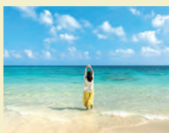
コロナ禍前のハワイにて。患者さんのためにも、早急な終息を心より願う毎日です。

看護師は、かつて私自身が経験したように、患者さんの不安を和らげることもできています。命をお預かりするという責任が重い仕事ですが、私は看護師という仕事に、心から誇りを持っています。