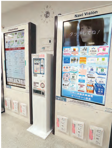
▲本館2階総合ホール設置

もう1台では、当院と連携している医療機関「登録医」を地区ごと、診療科ごとに検索することが可能で、患者さんに必要な「かかりつけ医」を探することができます。