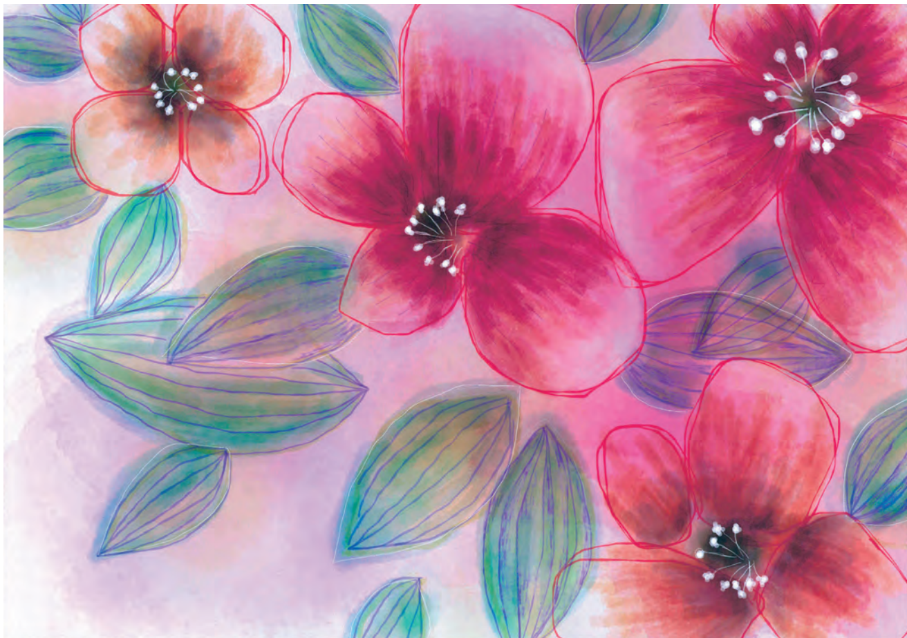
【しとり】 mai (エイブルアート・カンパニー所属 http://www.ableartcom.jp )