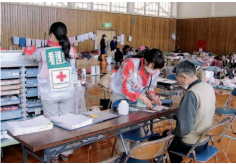
▶避難所での診療の様子

4月初めから5月末まで、約2カ月にわたり、計11チームを派遣し、山田町の避難所のひとつとなっていた岩手県立陸中海岸青少年の家を拠点として、避難所の診療や巡回診療に携わりました。また、この地区では診療チームと同時に「こころのケアチーム」を派遣しました。