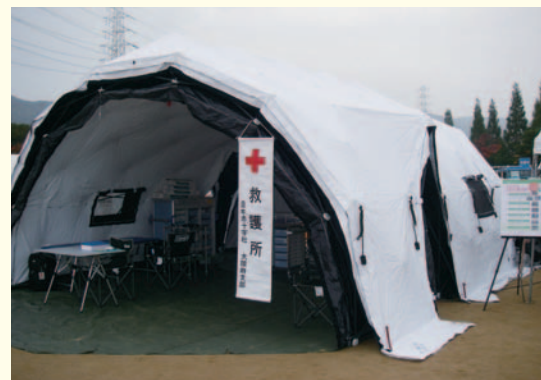
▲dERUを展開したところ