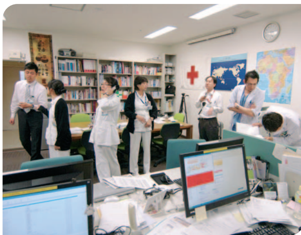
▲発災直後の国際医療救援部

平成23年3月11日14時46分、大阪赤十字病院も振幅の大きな揺れに見舞われ、すぐに東北で大きな地震が起こったことがテレビからわかりました。