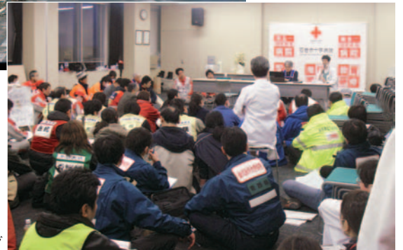
▶石巻圏合同救護チームのミーティング