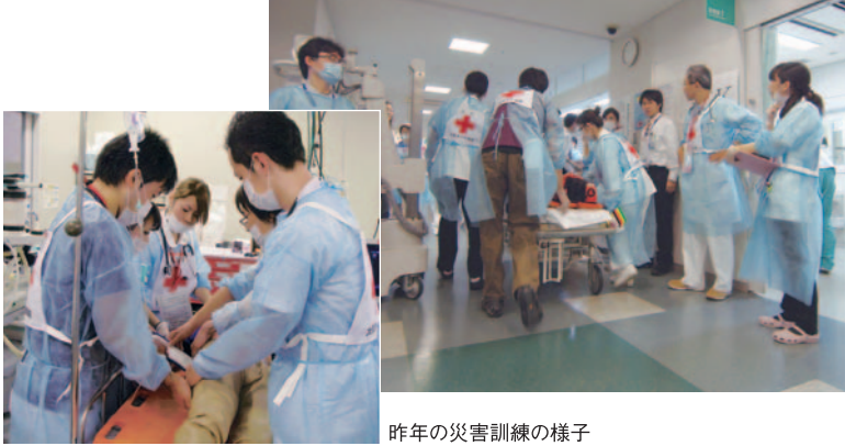
昨年の災害訓練の様子