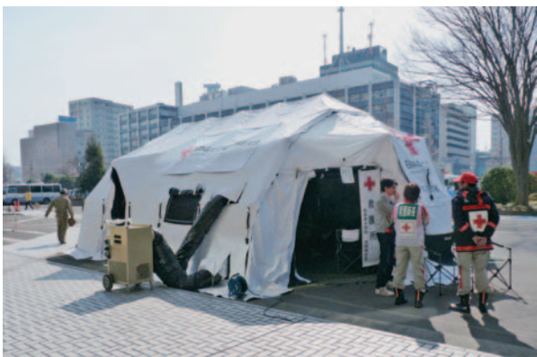
▲dERUのテント設営・診療開始