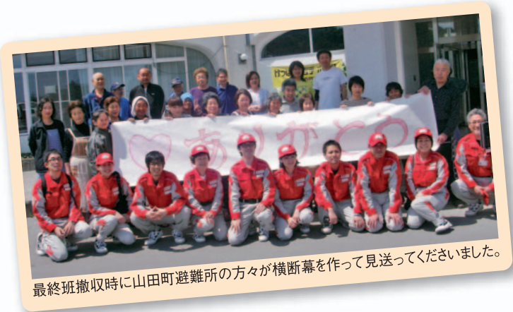
最終班撤収時に山田町避難所の方が横断幕を作って見送っていただきました。