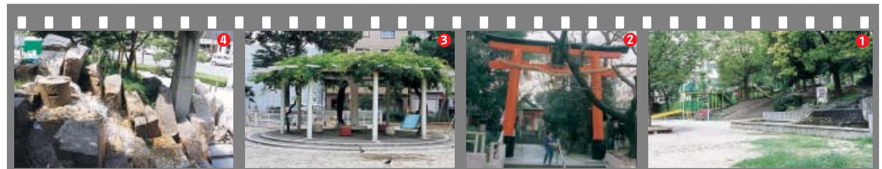
せせらぎの音が涼しげなフォンテーヌ上七公園 円形藤棚のある石ヶ辻公園 小橋公園につながる産湯福荷 滝のある東高津公園