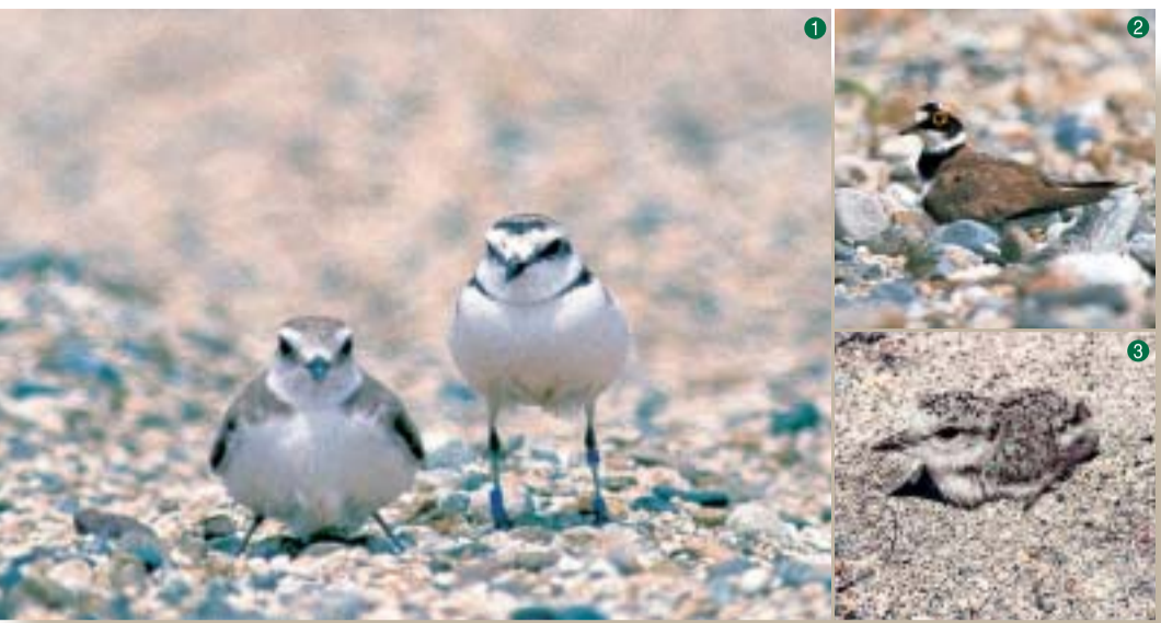
1 右に立っているおでこが黒い方がシロチドリのオス。すわっているのがメス 2 コチドリ 3 シロチドリのヒナ 4 シロチドリ 5 コチドリの卵 6 シロチドリの卵 7 イカルチドリの少し青っぽい色の卵

ツバメの若鳥たちが電線に並ぶ頃になりました。今年もたくさんヒナ鳥たちを無事巣立たせることができただでしょうか。