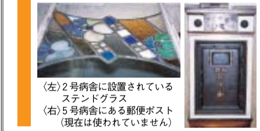
(左)2号病舎に設置されているステンドグラス (右)5号病舎にある郵便ポスト(現在は使われていません)